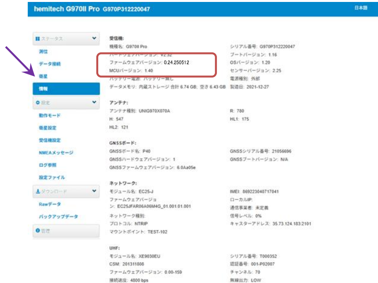
図 8 ファームウェアバージョンの確認

ファームウェアバージョンが: 0.24.250512 であることを確認してください。(赤い枠の部分)