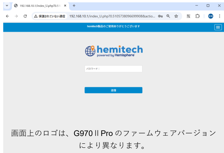
図 2 G970 II Pro ログイン

Web ブラウザを起動し、アドレスバーに『192.168.10.1』と入力します。 パスワードには、半角小文字で『password』と入力します。 接続 をクリックします。