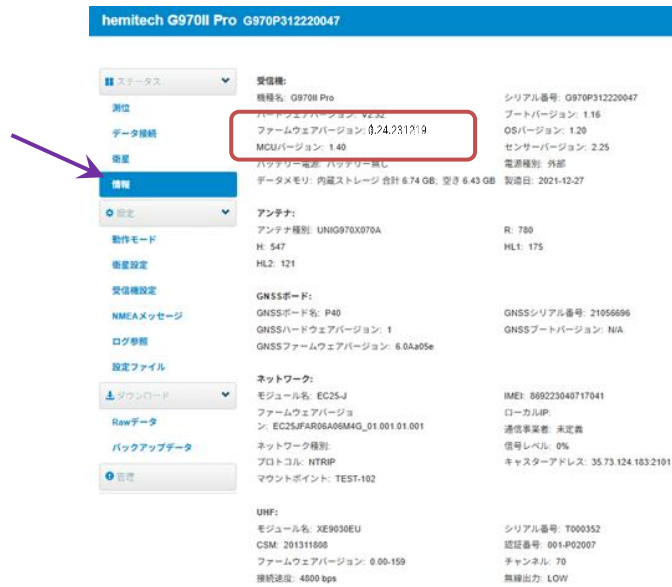
図 3 ファームウェアバージョンの確認

ファームウェアバージョンが: 0.24.250512 より古い物であることを確認してください。(赤い枠の部分)