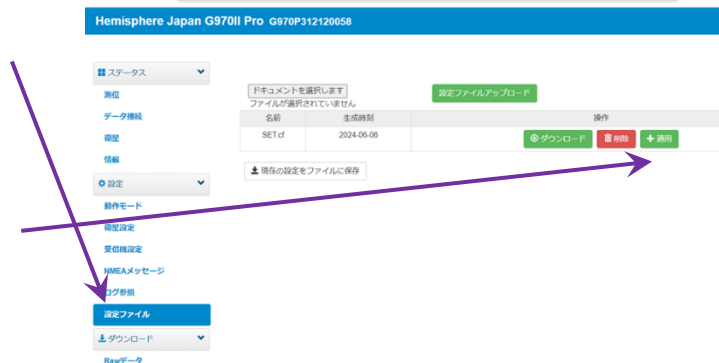
図 9 設定ファイル