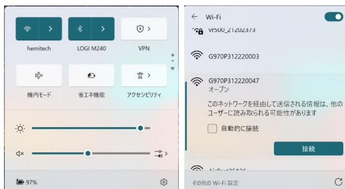
図 1 Wi-Fi 接続

接続する G970 II Pro のシリアル番号を選択し、 接続 をクリックし、Wi-Fi 接続させます。