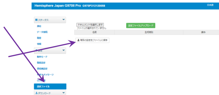
図 4 設定ファイル