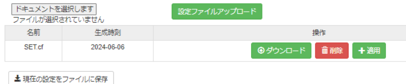
図 6 ファイルの確認